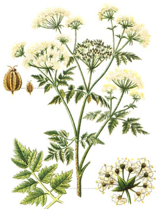
BOLEHLAV ŠKVRNITÝ ( Conium maculatum )