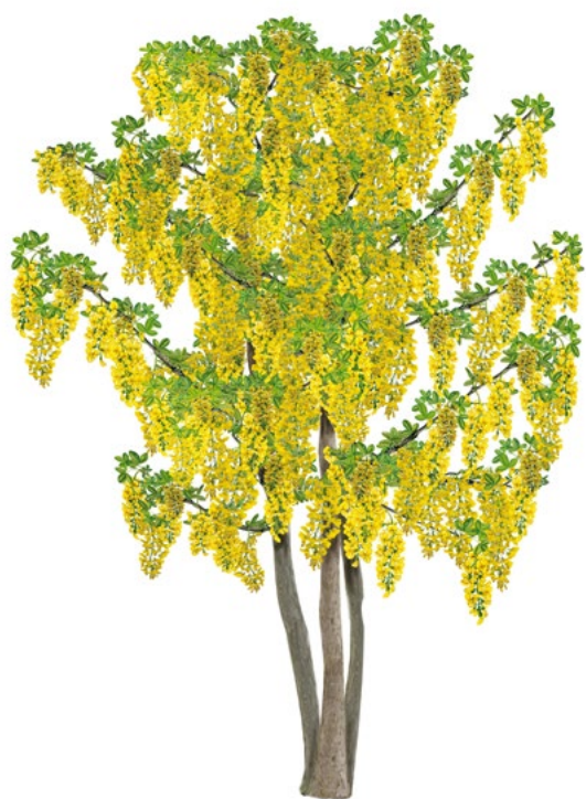
ŠTEDREC OVISNUTÝ ( Laburnum anagyroides )