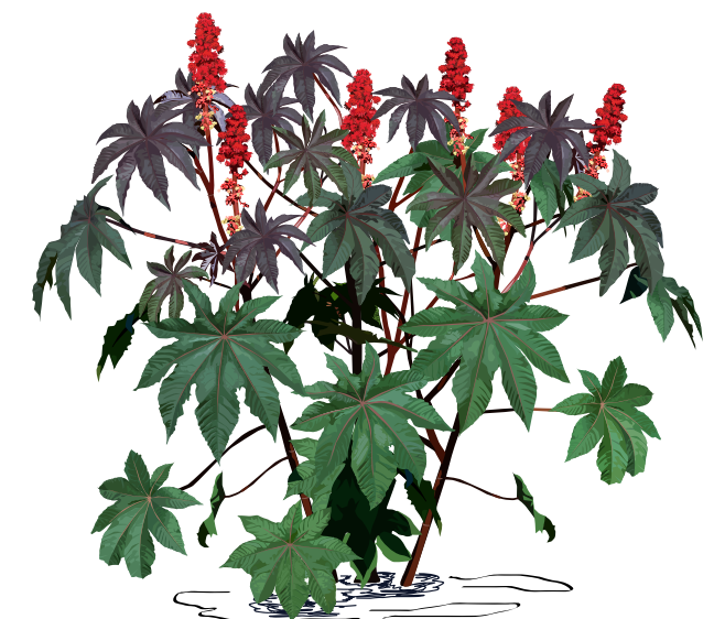
RICÍN OBYČAJNÝ ( Ricinus communis )