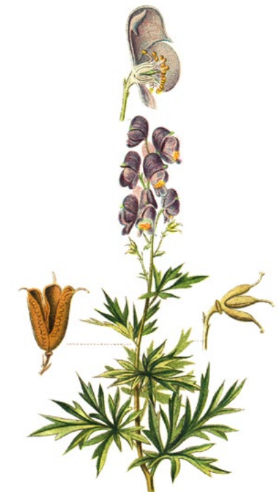
NÁPRSTNÍK ČERVENÝ ( Digitalis purpurea )