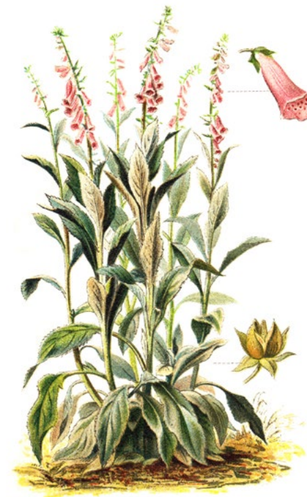
PRILBICA MODRÁ ( Aconitum napellus )