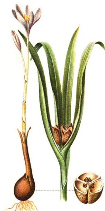
JESIENKA OBYČAJNÁ ( Colchicum autumnale )