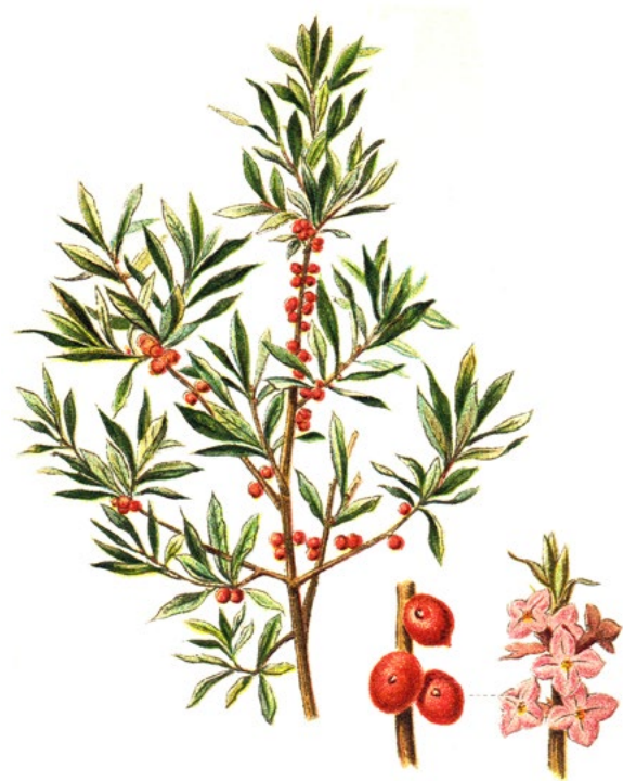
LYKOVEC JEDO VATÝ ( Daphne mezereum )