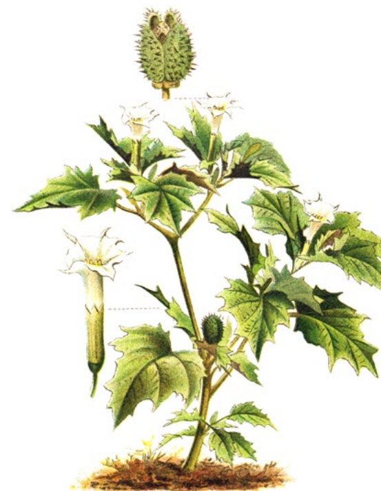
ĽULKOVEC ZLOMOCNÝ ( Atropa belladonna )