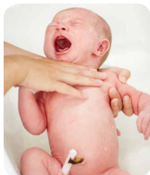
4. Osobitnú pozornosť venujeme umytiu záhybov v oblasti krku.