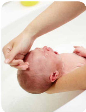
6. Potom opláchneme vlásky, na čo nepotrebujeme šampón.