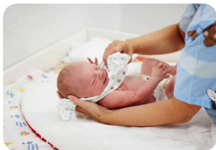
1. Dieťaťko pred kúpaním opatrne vyzlečieme.