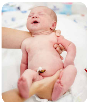
2. Správne uchytiť dieťaťko, aby sa nám nevyšmyklo. Jedna ruka obopína rameno dieťaťa, druhou rukou mamička obopína stehno.