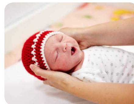
18. Po kúpaní oblečíme čiapočku.