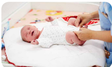
14. Dieťa oblečíme do čistého suchého oblečenia.