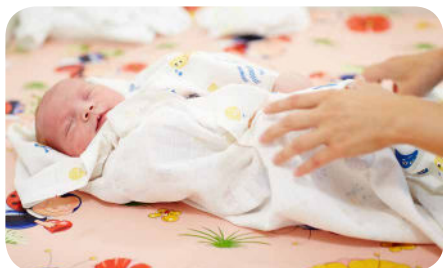
10. Bábätko po kúpaní položíme na pripravenú osušku a zabalíme ho do nej, nešúchame ho.