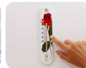
2. Teplota v miestnosti má byť okolo 24 až 25 °C.