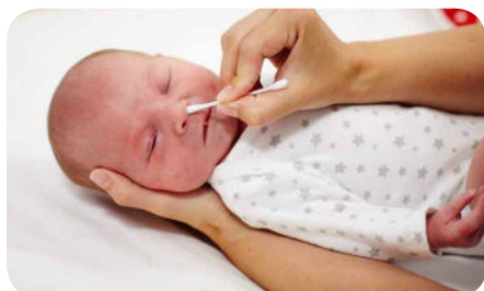
15. Vátovými štetôčkami vytrieme jemne noštek, pričom nezachádzame do hĺbky.