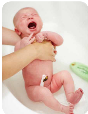
7. Opláchneme ruky a hrudník.