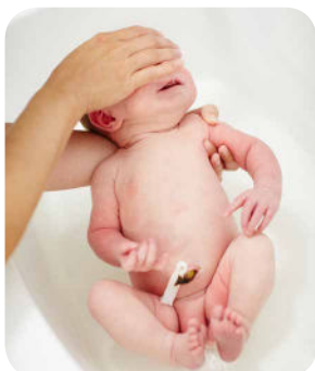
3. Kúpanie začneme jemným umytím tváričky bábäťka.