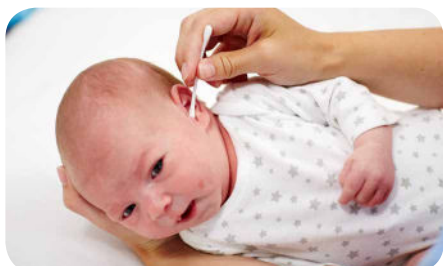
16. Osušíme jemne vátovou štetôčkou povrch zukovodu, nezachádzame do hĺbky.