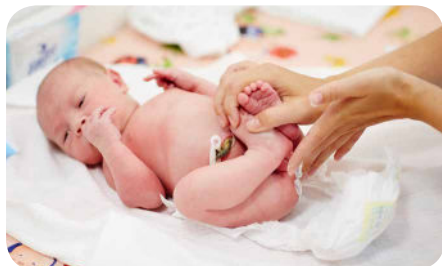
13. Dáme plienku a zadoček ošetríme tenkou vrstvou krému proti zapareninám.