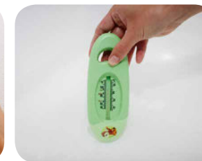
3. Do vaničky nalejeme vodu s teplotou približne 37 °C.