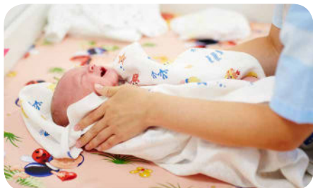
12. Vysušíme všetky kožné záhyby.