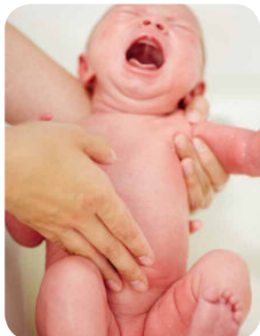
5. Opláchneme oblasť bruška a okolie pupka.