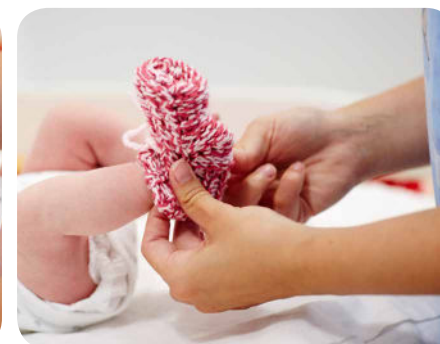
19. Na nožičky obujeme papučky alebo ponožky.