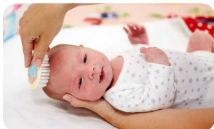
17. Vlasy opatrne prečesáme kefkou.