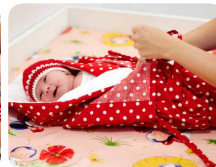
21. Môžeme zabalíť na chvíľku rúčky, aby sa zohriali.