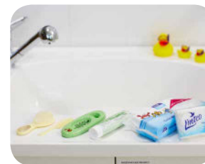
1. Pripravíme si pomôcky na kúpanie.