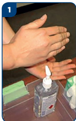
1 Vydezinfikujte si ruky