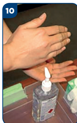
10 Vydezinfikujte si ruky