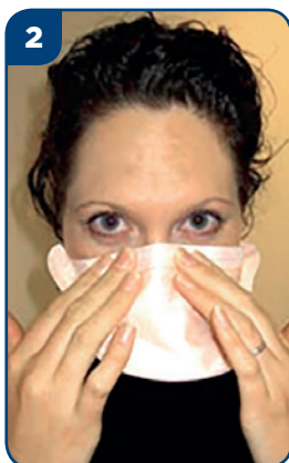
2 Nasaďte si masku