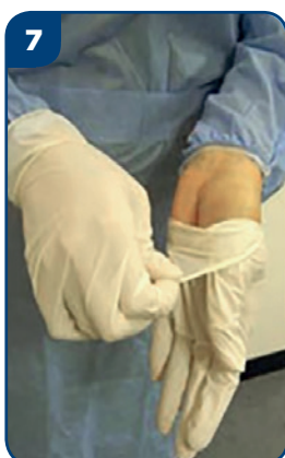
7 Dajte si dole rukavice