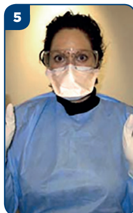
5 Navlečte si rukavice