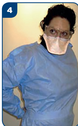
4 Oblečte si plášť