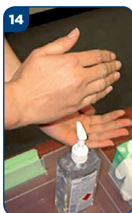
14 Vydezinfikujte si ruky