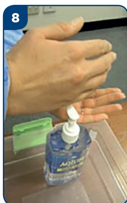
8 Vydezinfikujte si ruky