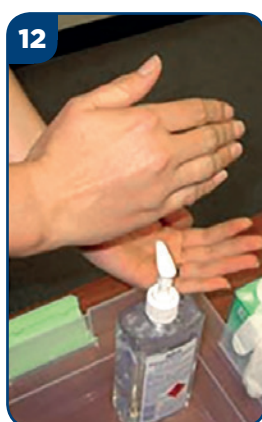
12 Vydezinfikujte si ruky