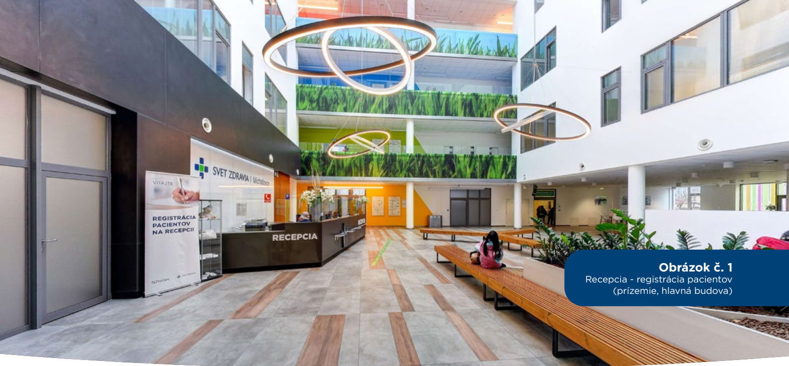
Obrázok č. 1 Recepcia - registrácia pacientov (prízemie, hlavná budova)